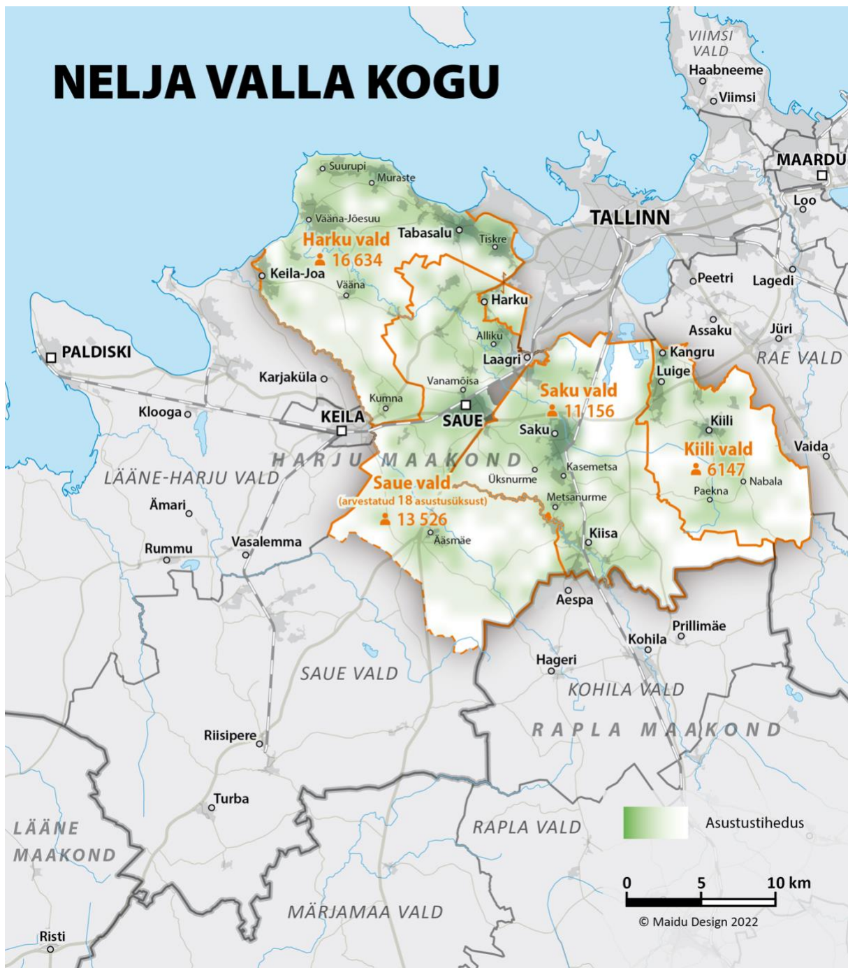
Joonis 1. NVK tegevuspiirkonna kaart

Tegevuspiirkond (623,6 km 2 ) asub Harjumaa (4328 km 2 ) lääne-, edela- ja lõunaosas, piirnedes Tallinna linnaga. Piirkond hõlmab nelja kohaliku omavalitsuse territooriumeid – Harku, Kiili, Saue ja Saku, sh Harku, Saku ja Kiili valda tervikuna, Saue valla endise Saue linna ja Saue valla ala (v.a Laagri alevik ning endise Kernu ja Nissi valla külad), moodustades Harjumaa 14,4% (Joonis 1).